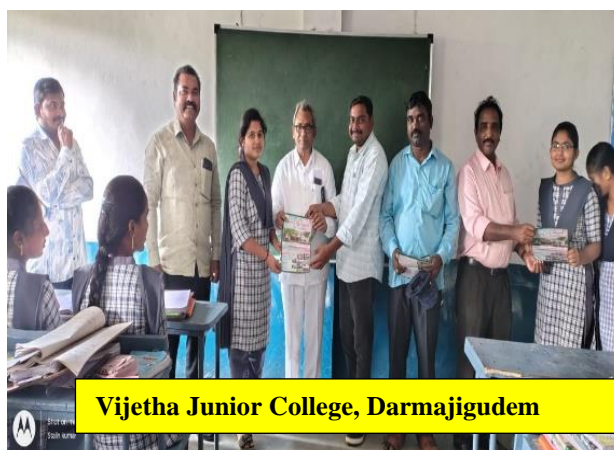
Vijetha Junior College, Darmajigudem

On 29 and 30 January 2025, with the instructions of Hon'ble Director of Commissionerate of Collegiate Education, AP, Mangalagiri, Government Degree College, Chintalapudi Staff and Students visited near by Junior Colleges and invited them to visit the college on OPEN DAY in the first week of February to explore the facilities and opportunities available.