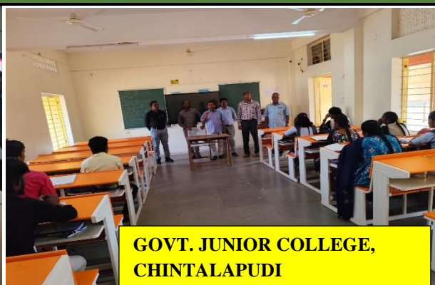
GOVT. JUNIOR COLLEGE, CHINTALAPUDI