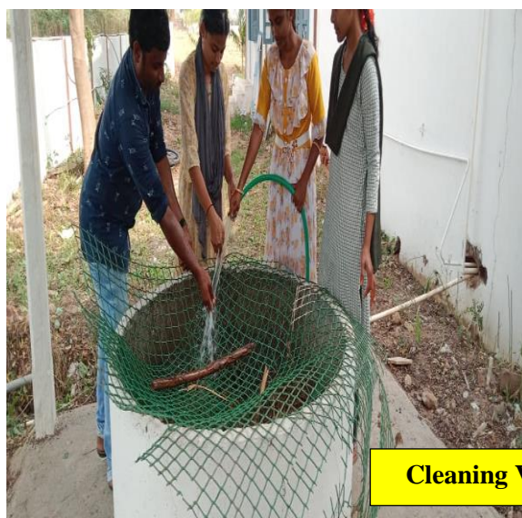
Cleaning Vermicompost Unit and its Surrounds