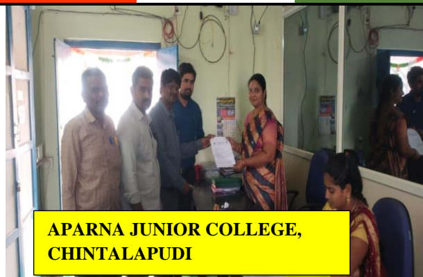
APARNA JUNIOR COLLEGE, CHINTALAPUDI