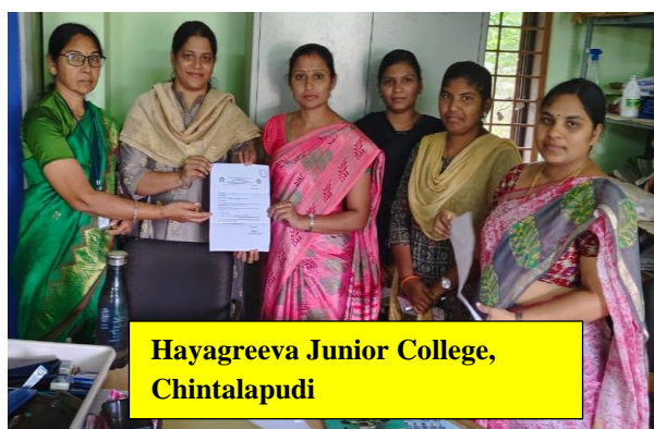
Hayagreeva Junior College, Chintalapudi